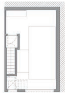
Planta Soterrani. Box aparcament

Superficie construida con zonas comunes: 124 m 2 Superficie exterior: 205 m 2 Garaje privado: 37 m 2